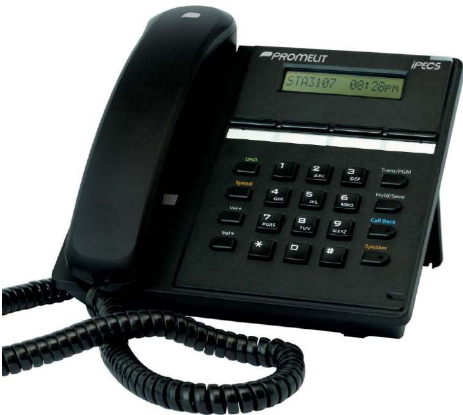
Telefono LIP 8004D