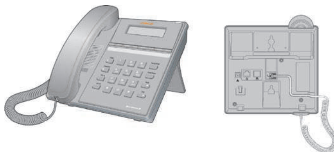
LIP-8004D Fronte e Retro

Il telefono iPECS LIP-8004D incorpora la più recente tecnologia VoIP destinata alle comunicazioni di base. La seguente immagine mostra il telefono LIP-8004D.